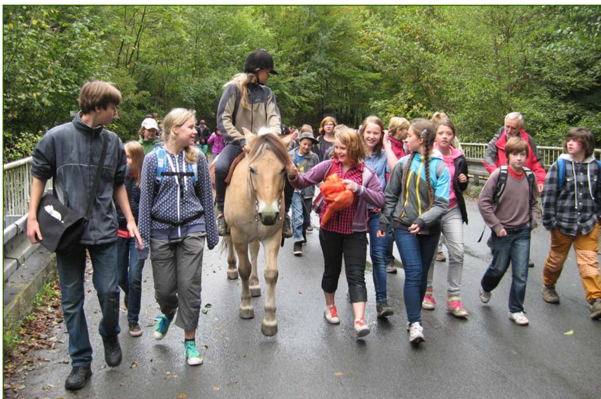
Návrat žáků i učitelů ze Svatého Jana pod Skalou.